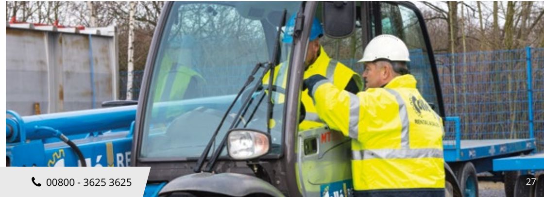
Combinatie heffen, hijsen en hoogwerken ook mogelijk, tijdsduur 1½ dag.