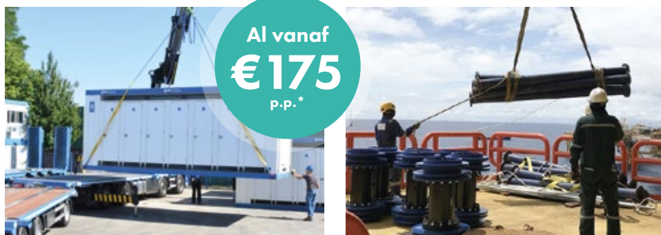
*Genoemde prijs per persoon bij een training Hijbegeleider Basis (herhaling/expert) 1-4 personen.

Wanneer de training is afgerond, ontvangt iedere medewerker naast een hijsbewijs ook nog een groen TCPR-boekje. Hier moet de opgedane hijservaring in opgenomen worden. Die wordt vervolgens door de werkgever of opdrachtgever afgestempeld. Met het TCPR-boekje laat je zien dat je in de vijf jaar na certificatie minstens acht kwartalen in die functie hebt gewerkt. Twee van deze acht kwartalen moeten overigens in de laatste drie jaar hebben plaatsgevonden.