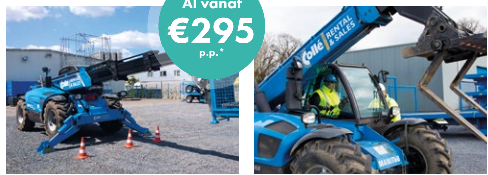
*Genoemde prijs per persoon bij een groepstraining Verreiker SOG/SSVV Heffen vanaf 8 personen.